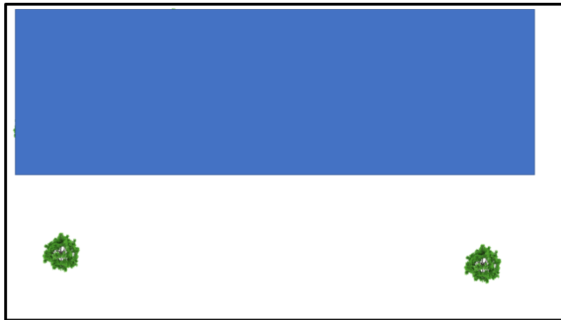
Figura No. 2 Ejemplo de diseño sin considerar prevención de afectación.